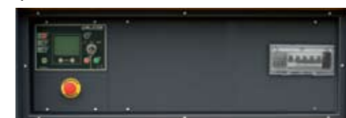
QPE-C-OC ( +011) Automatic panel without switching on board Quadro automatico senza commutazione