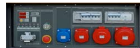
QMC-01 ( +012) Manual panel and socket module