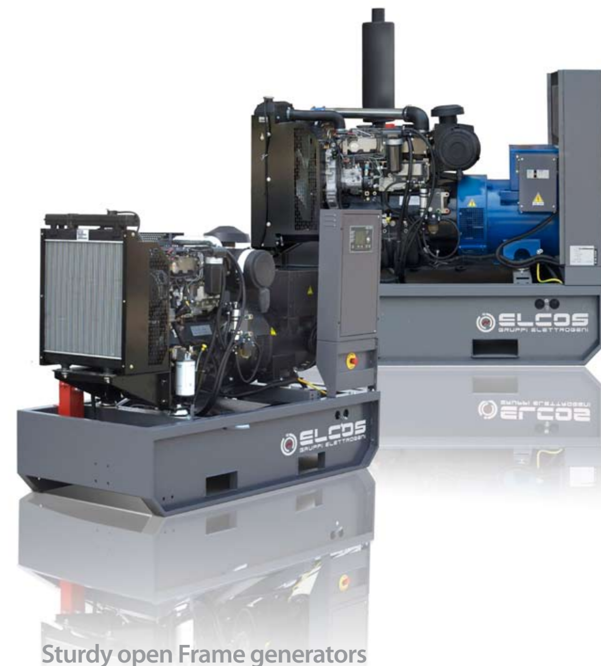
Sturdy open Frame generators

50 Hz 1500 r.p.m. 400/230 V - 60 Hz 1800 r.p.m. 480/240 V