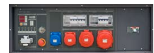
QMC-01 (+012) Manual panel and socket module Quadro manuale e modulo prese

Il quadro QPE-C rappresenta l'evoluzione dei quadri per il comando e la gestione del gruppo elettrogeno. La sua logica a microprocessore è in grado di soddisfare qualunque funzionalità richiesta dall'utente, infatti la doppia modalità di funzionamento MANUALE o AUTOMATICA garantisce ad ogni tipo di funzionalità la giusta protezione, analisi e controllo del GE in modo da rendere la gestione facile ed efficiente.